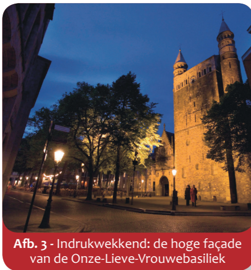
Afb. 3 - Indrukwekkend: de hoge façade van de Onze-Lieve-Vrouwebasiliek

Dat Maastricht een oude stad is, kun je aan veel gebouwen goed zien. Zo vind je in Maastricht bijvoorbeeld twee van de oudste kerken van Nederland, die er beide al ruim 1 500 jaar staan: de Sint-Servaasbasiliek (afb. 2) aan het Vrijthof en de Onze-Lieve-Vrouwebasiliek (afb. 3), met haar indrukwekkende façademuur.