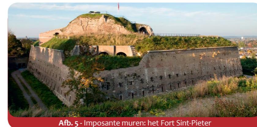
Afb. 5 - Imposante muren: het Fort Sint-Pieter

Veel jonge mensen komen naar Maastricht om aan de universiteit of hogeschool hun latere beroep te leren. Aan de Universiteit Maastricht (afb. 7) studeren 13 000 studenten om later bijvoorbeeld arts, advocaat of manager te worden. Omdat de studenten uit veel verschillende landen komen, wordt het onderwijs veelal in het Engels gegeven. De Universiteit Maastricht en de Academie voor Beeldende Kunsten trekken ook veel jonge mensen uit de buurlanden Duitsland en België aan.