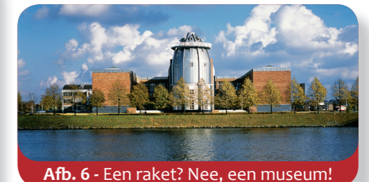
Afb. 6 - Een raket? Nee, een museum!

Maar in Maastricht studeren niet alleen jonge mensen uit veel Europese landen. De stad zet zich ook in voor een nauwere samenwerking tussen deze Europese landen en voor goed nabuurschap. In 1992 ondertekenden de regeringsleiders van 12 landen in het gouvernement (provinciehuis) het "Verdrag van Maastricht", waarmee de Europese Unie officieel werd opgericht.